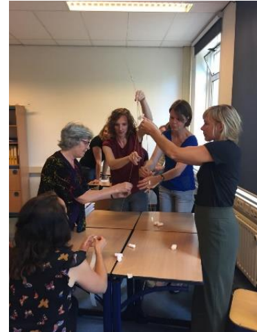
Leerlingen en docenten bogen zich op de kennismakingsmiddag over de 'marshmallow challenge'